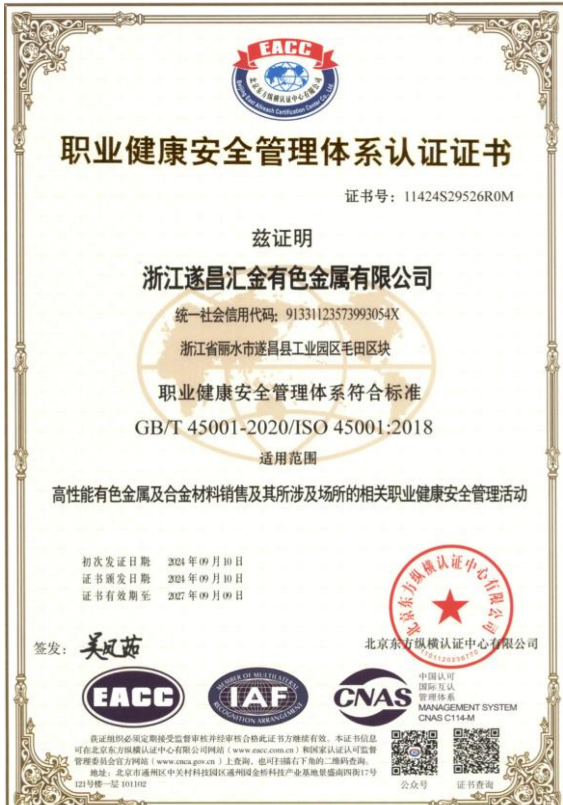
图表 15 职业健康安全管理体系证书