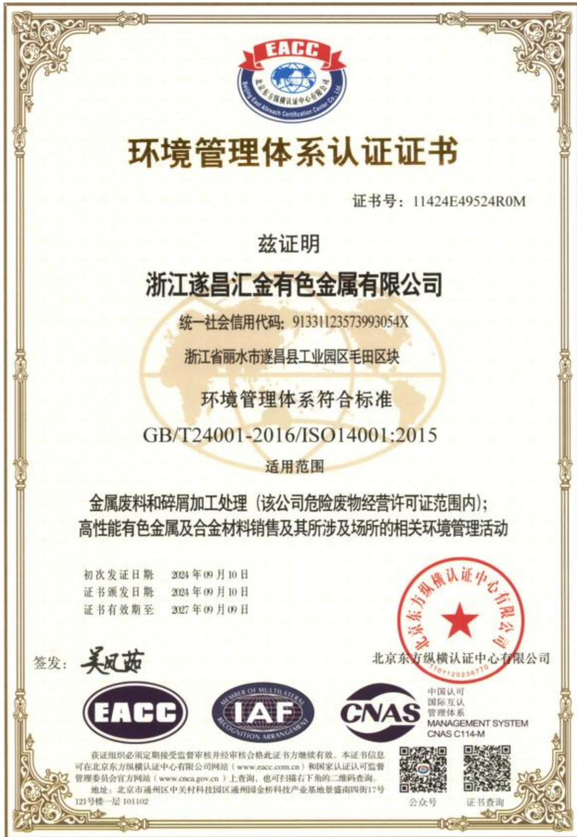
图表 14 环境管理体系证书